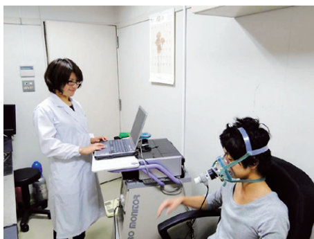
図1 呼気ガス装置を利用した体内代謝評価

健康状態の維持、疾患の予防や治療に貢献するために、「栄養成分」は単一成分としての効果を評価するだけでなく、「何と組み合わせるのか(もしくは効果を発揮しないのか)」、「どの時間(タイミング)で食べることが良いのか」、「なぜ、個人差を生じるのか」など、様々な視点で評価することが重要です。これらはすべて、生体の代謝動態(血液、尿、呼気中ガス等)から総合的に評価することで証明することが可能となります。特に、「食後」の代謝動態は、疾病を予測する手段としても着目されていることから、本研究室では、人間栄養学、時間栄養学に着目し、研究を行っています。